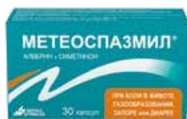
РУ № П N013069/01 от 05.11.2020 Метеоспазмил®

Применение препарата Метеоспазмил® может облегчить процедуру колоноскопии за счет уменьшения спазма кишки, избыточного газообразования и пенистого секрета, а также способствует уменьшению вздутия, боли в животе — проявлений реактивного кишечного дискомфорта после процедуры 4